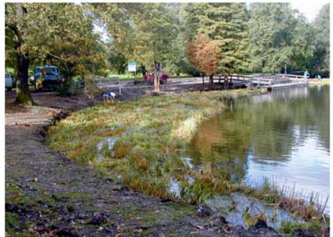
Die Matten sind ausgerollt und befestigt The mats are unrolled and fixed