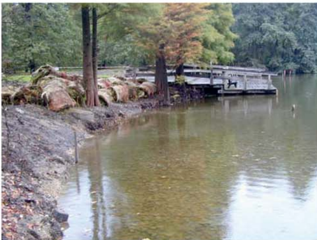
Die Flachwasserzone ist baulich vorbereitet The area of shallow water is prepared.

An einem innerörtlichen Parkgewässer wird eine Flachwasserzone geschaffen. Die Wassertiefe in diesem Bereich beträgt 10 – 20 cm. Im ersten Bild sieht man die angelieferten Röhrichtmatten am Ufer liegen. Diese werden dann in der Flachwasserzone ausgerollt und festgelegt. Sofort ist ein dichter Bewuchs vorhanden, den auch Wasservögel nicht verbeißen können. Das letzte Bild zeigt die Entwicklung im ersten Jahr.