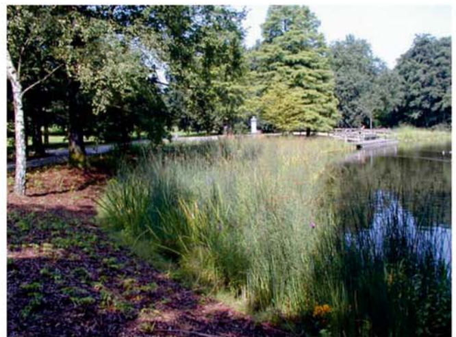
Entwicklung im ersten Jahr Development in the first year